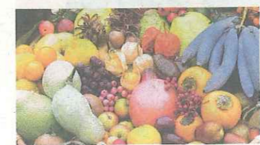
Das Praxishandbuch macht Lust auf das Entdecken und Experimentieren im eigenen Garten.

KLOSTERNEUBURG. Siegfried Tatschl stellt beim „cafe philosophicum“ am Mittwoch, dem 10. Juni, um 19.30 Uhr im Melarium von Apis-Z sein neues Buch vor: „555 Obstsorten für den Permakulturgarten und -balkon“. Der Naturgärtner beschäftigt sich seit Jahren mit Permakultur und der Idee von „Essbaren Lebensräumen“.