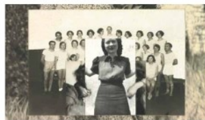
Lejo: abheben, Collage auf Karton.

Von August Walla sind Instamatic-Farbfilm-Fotos, welche vom Originalnegativ vergrößert, auf Kartons aufgezogen und vom Künstler mit Zeichnungen und Schriften versehen wurden, und rare, vom Künstler auf der Rückseite beschriftete, schwarz-weiße Vintageprints zu sehen. Von 29. September bis 23. November.