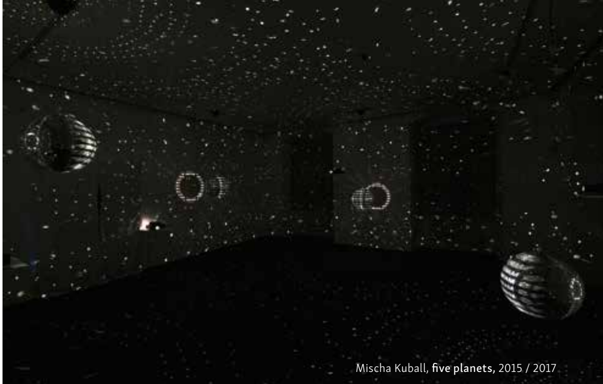
Mischa Kuball, five planets , 2015 / 2017