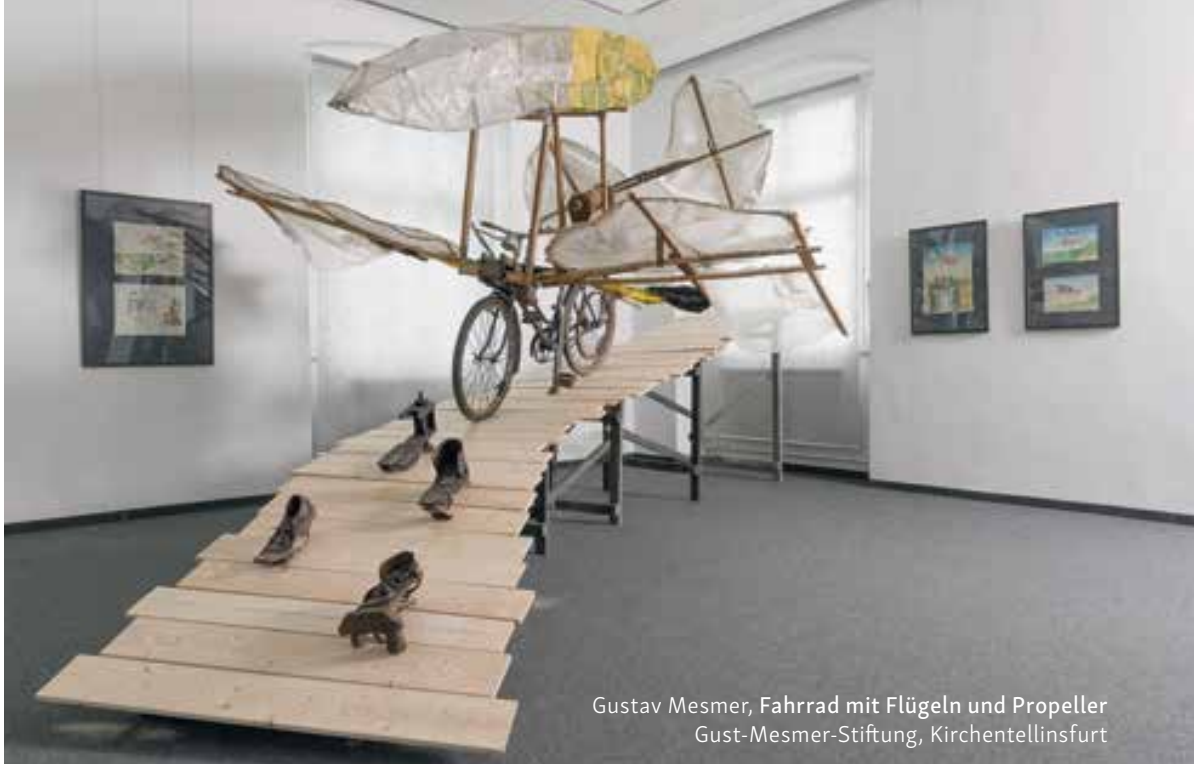
Gustav Mesmer, Fahrrad mit Flügeln und Propeller Gust-Mesmer-Stiftung, Kirchentellinsfurt