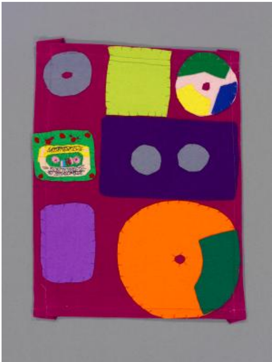
Junko Yamamoto, 1990, Disk and Tape, Courtesy Yukiko Koide