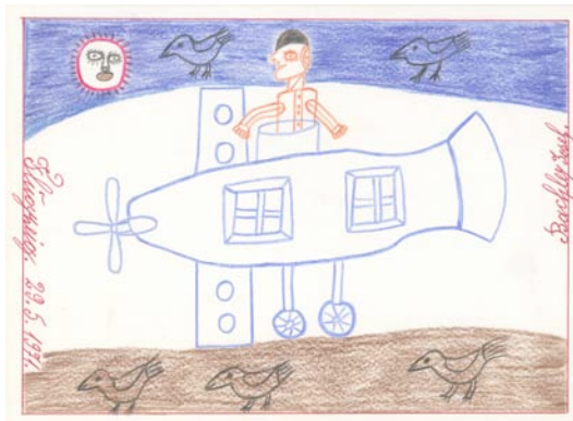
Josef Bachler, 1971, Flugzeug Bleistift, Farbstifte, 21 x 28,5 cm

Werke von Helmut Hladisch und Jürgen Tauscher sind noch bis 7. September 2014 in der Ausstellung "small formats.!" im museum gugging zu sehen.