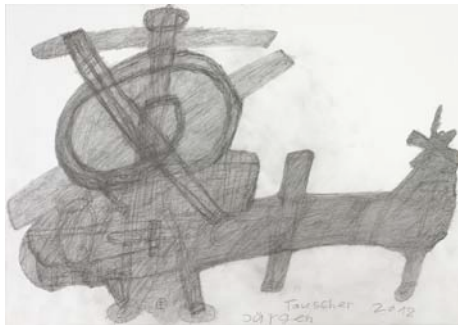
Jürgen Tauscher, 2012, Flug Objekt Bleistift, 29,7 x 42 cm

Vernissage 11. Juni 2014, 19 Uhr Dauer: 12. Juni bis 2. November 2014